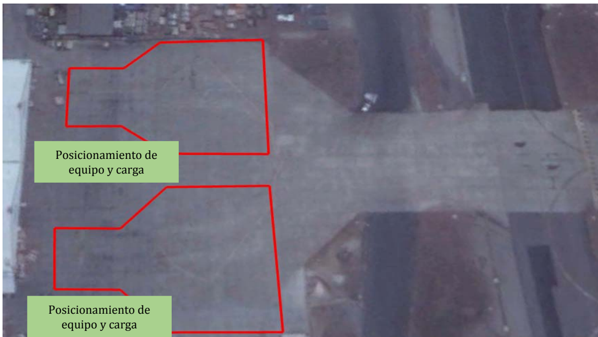
FIGURA 1: Medidas de seguridad adicionales al operar en posiciones 1 y 2