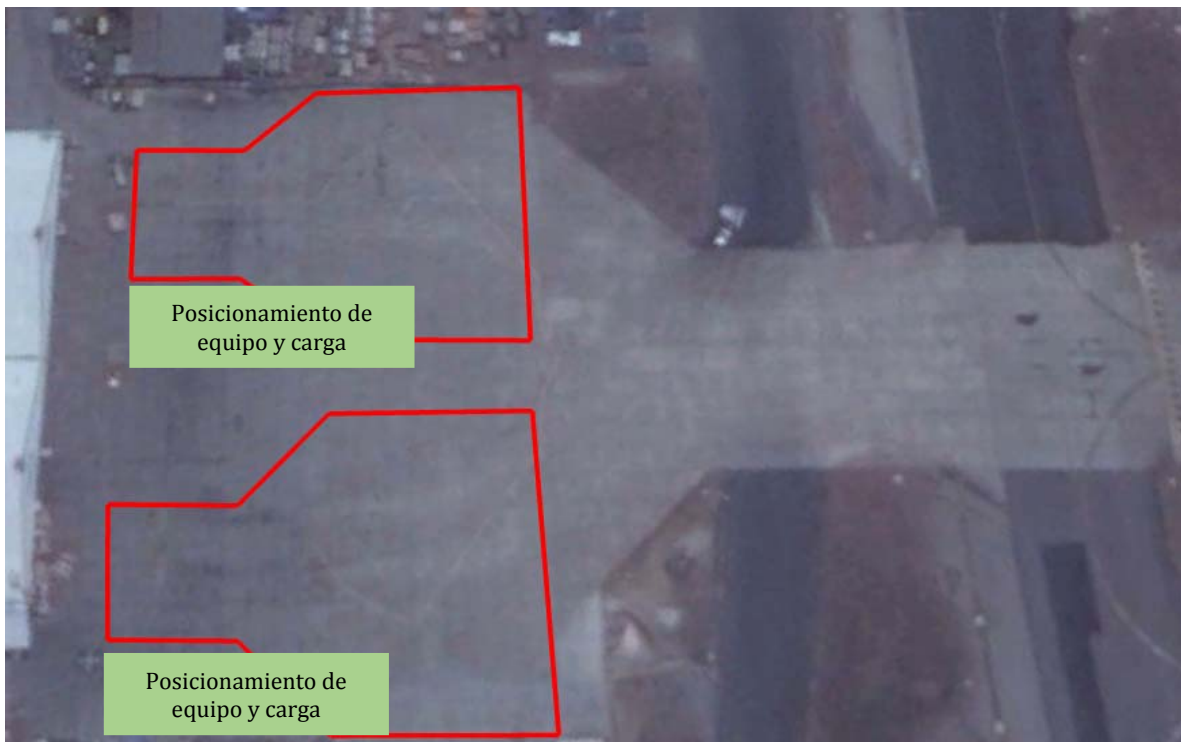
FIGURA 1: Medidas de seguridad adicionales al operar en posiciones 1 y 2